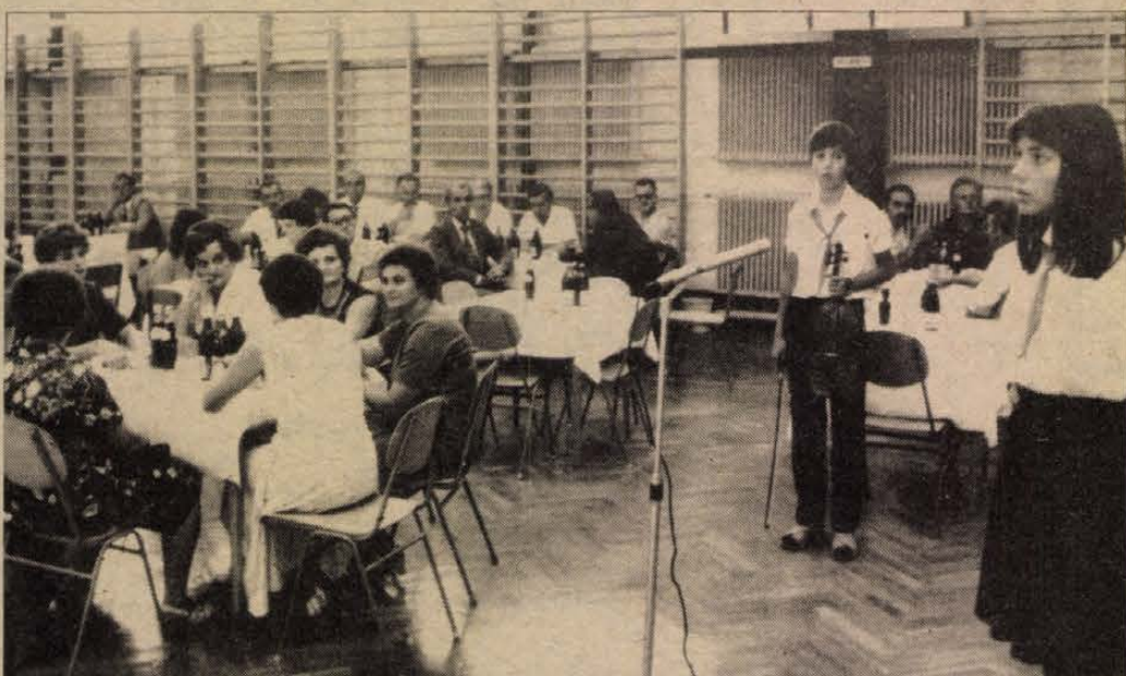
Az iskola tanuló; műsorral köszöntötték a társadalmi munkásokat.