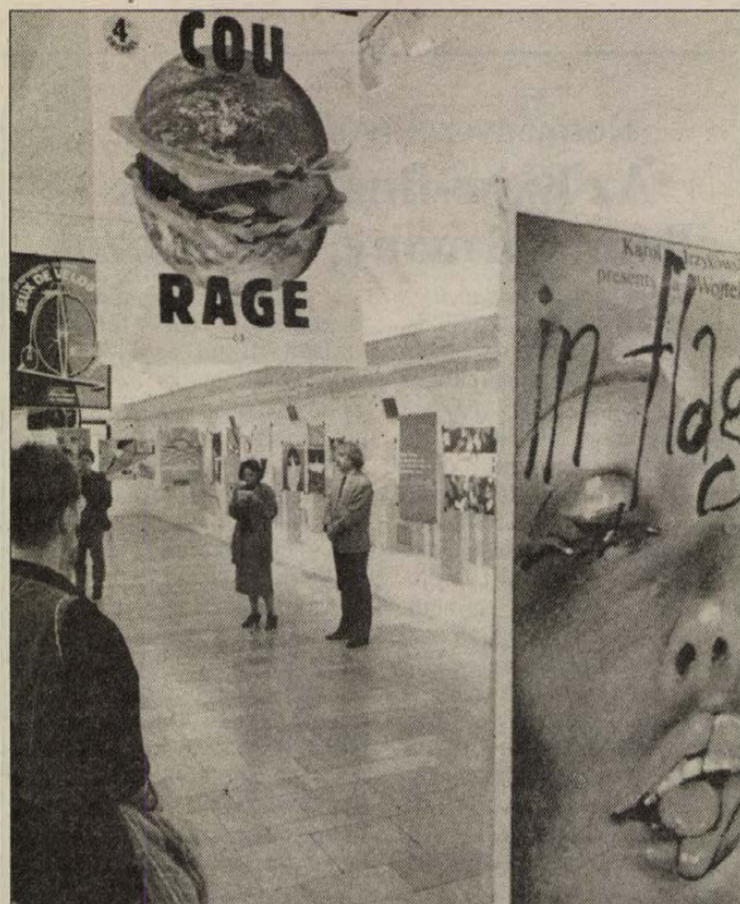
Tizenhét ország plakátjai láthatók a kiállításon

Ismeretes, hogy nemrégiben halálos kimenetű baleset történt Turán, amikor a mezőőr két körtét csenő cigányra lött. (Folytatás a 2. oldalon)