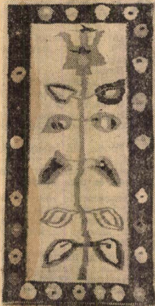
Ferk Anna: Növény (szőnyeg)

AZ „IPARMŰVÉSZETI STÚDIÓ” olyan alkotócsoporthoz tartozik, amelynek egyetlen kiállító kivételével, semmi köze sincs az iparművészethez.