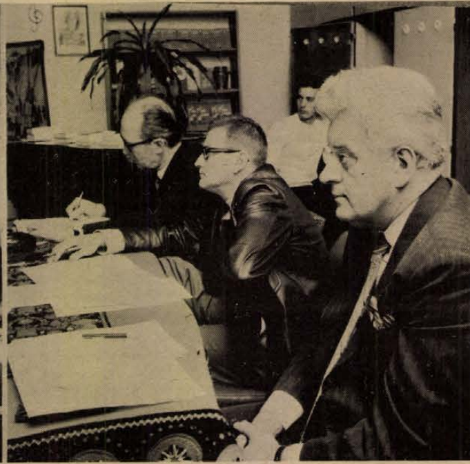
JÓT, s JÓL Ebben áll a nagy titok... (Kazinczy Ferenc)