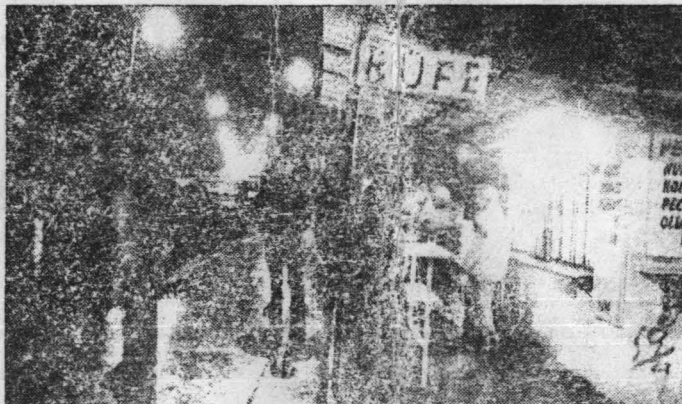
Éjjeli szolgáltatás, olcsóbb mint hazt