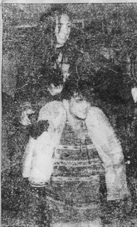
Fogózs helyett loccskáltak

levegőben. A fiatalok pedig az orkánscapdosású zenére szinte extázisban vonaglanak.