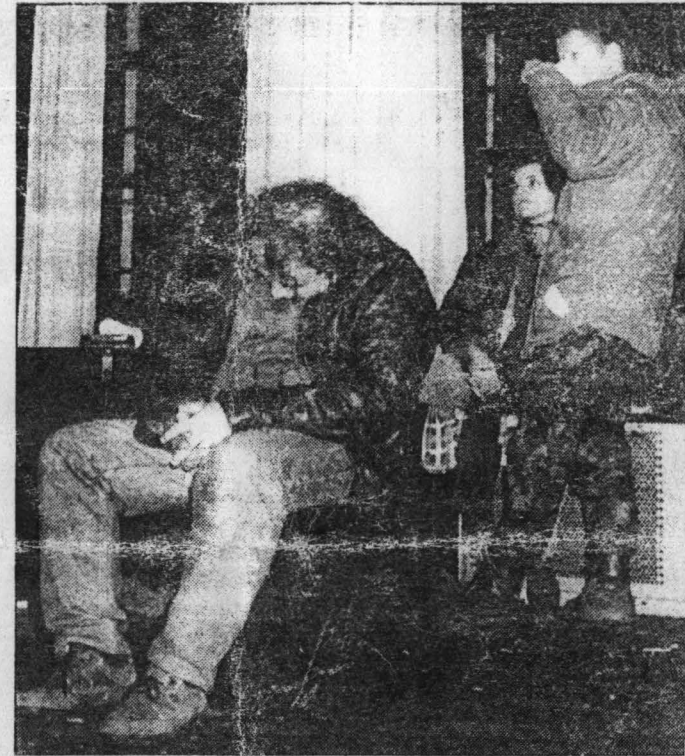
Egy megfáradt harcos pihen

– Néhány hete van itt ez a hely s szívesen járok ide. Most a „Hétköznapi csalódások” nevű pécsi zenekar játszik.