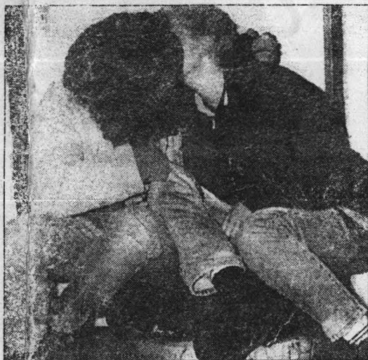
Peccételjük meg barátságunkat

A, ez olyan, mint koncerteken szokott lenni. A gyerekek most „fogóznak”, ez nem brutális, különféle mozgásokat végeznek. A punkzenére ezt kell csinálni, de van olyan zene is, amire ugrálni kell.