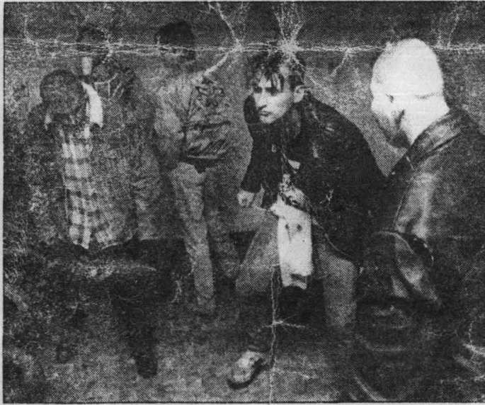
Ezek mi vagyunk, a Hétköznapi csalódások

rel és N. Zsófiával, aki szintén helybeli. (Beszélgetés előtt kikötük, hogy fénykép nem készülhet róluk és a teljes nevüket sem írhatjuk ki.) A fiú szakácsnak tanul, a kislány elsős a Madách gimnáziumban, s grafi-